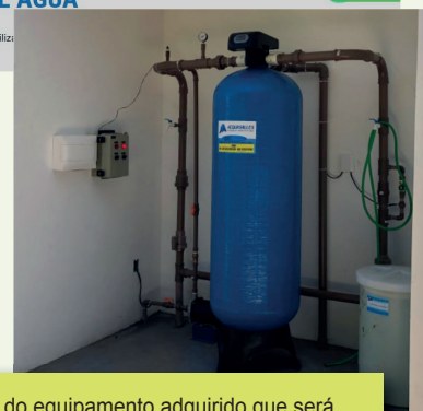
Modelo do equipamento adquirido que será instalado na Estação de Tratamento de Água

a cargo da Acquasalles, que irá instalar um filtro, com a especificação relacionada à vazão do poço artesiano, para que possam ser eliminadas as partículas maiores como ferro, além de dosadores automáticos de cloro que eliminam a contaminação bacteriológica.