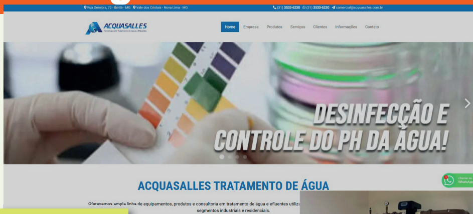
Site da Acquasalles

As obras serão iniciadas neste mês de fevereiro e o sistema será implantado em etapas.