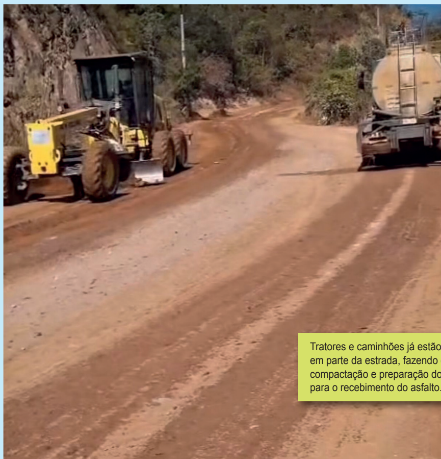
Tratores e caminhões já estão presentes em parte da estrada, fazendo o acerto, compactação e preparação do piso para o recebimento do asfalto.