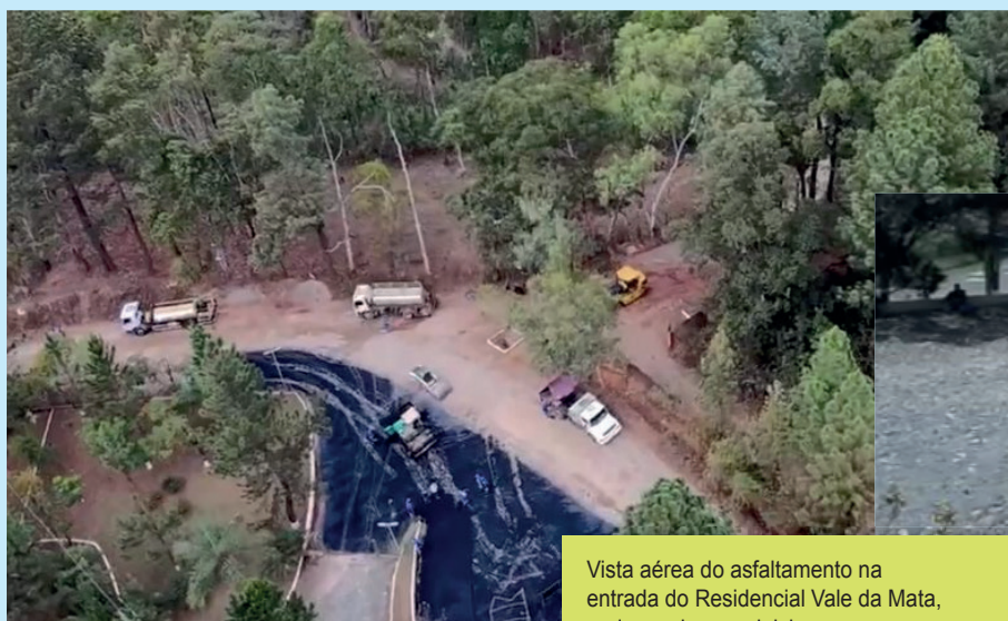
Vista aérea do asfaltamento na entrada do Residencial Vale da Mata, onde as obras se iniciaram

Os moradores do Vale da Mata esperam que as obras avancem e que sejam concluídas ainda em 2025, trazendo segurança, conforto e valorização para todos os moradores e proprietários de imóveis no Residencial.