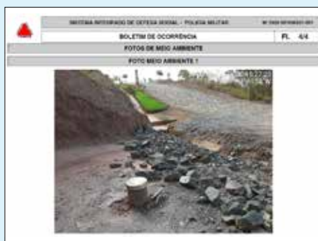
Fotografia do poço artesiano tamponado, feita pela equipe da PMMG, na apuração da denúncia

A diretoria lamenta profundamente que existam pessoas que, além de não concordar com as ações definidas pela maioria, cumprindo-as democraticamente, não se dignam em assinar e colocar seu nome na denúncia e ser, também, ético e transparente como se deve, em uma comunidade que está se formando e se firmando cada vez mais.