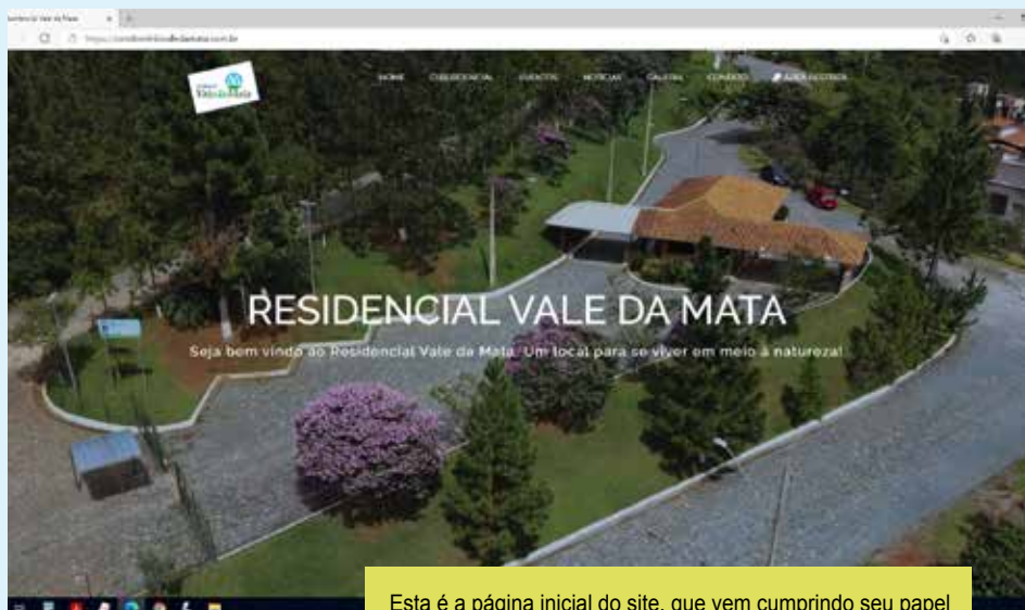
Esta é a página inicial do site, que vem cumprindo seu papel na divulgação do condomínio e interação dos proprietários

Já no início de dezembro de 2020 o perfil apresentado pelo Google MyBusiness mostrava que em novembro o site recebeu 1.366 visualizações, com 24 solicita-