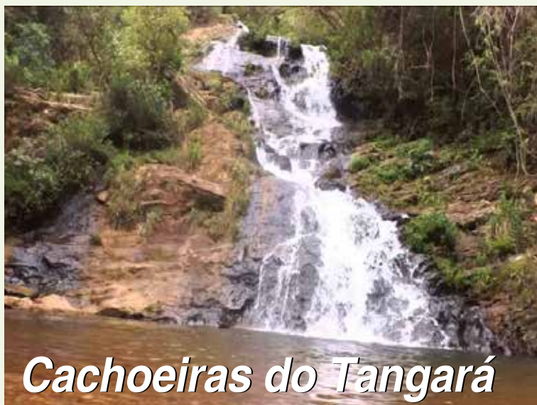
Cachoeiras do Tangará

Nesta edição apresentamos 3 cachoeiras localizadas dentro do condomínio fechado Cachoeiras do Tangará. Conheça a Cachoeira da Tarde, o Poço da Onça e a Cachoeira da Andorinha. Página 6