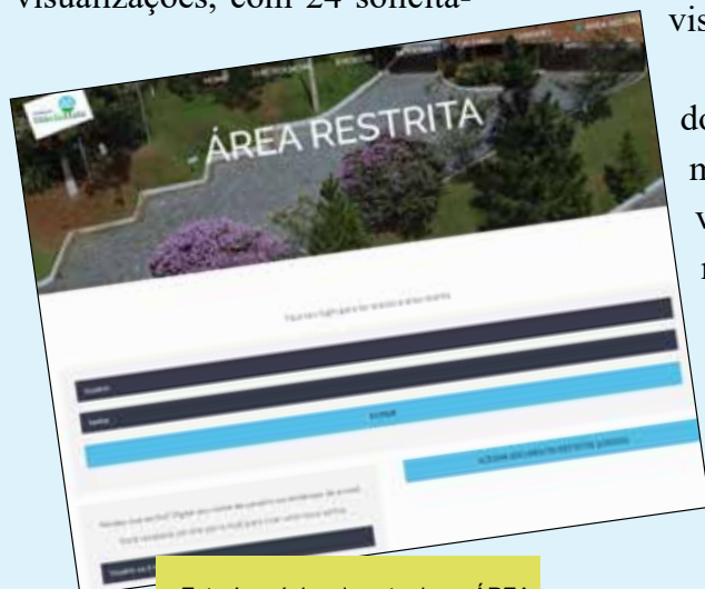
Esta é a página de entrada na ÁREA RESTRITA, destinada apenas aos associados da AMOVM para acesso a documentos e solicitações

Se por algum motivo você ainda não finalizou seu registro na ÁREA RESTRITA, entre em contato com a Administração para ter ajuda ou receber informações que contribuam para a efetivação de seu login nesta área do site, que é reservada especialmente a você proprietário.