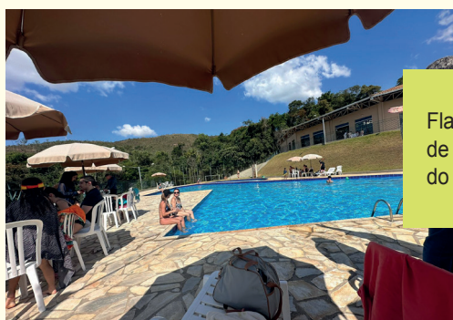
Flagrantes do sábado de sol na reabertura do clube do Vale da Mata