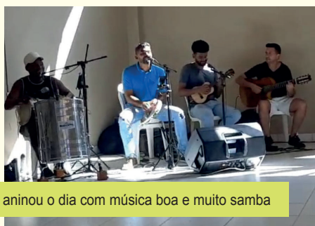
O grupo SAMBA SÔ aninou o dia com música boa e muito samba