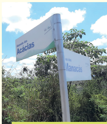
As placas de sinalização se encontram ilegíveis após 5 anos de sua implantação no Vale

A manutenção será feita em dois momentos, inicialmente com a troca das placas de rua e portaria e em seguida com a substituição das placas do clube.