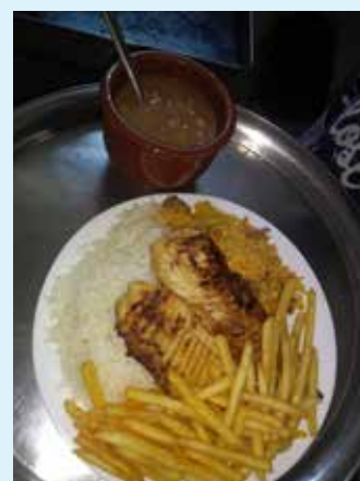
O cardápio para almoço pode ser individual ou para servir duas ou mais pessoas

para o número 98717-6156 e fazer suas encomendas, escolhendo as opções e horário do almoço para que a equipe possa preparar com carinho os pratos que podem ser individuais ou que servem duas ou mais pessoas, conforme cardápio disponível no clube.