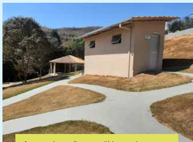
As passarelas que ligam o vestiário aos quiosques e quadras de tênis e peteca foram recuperadas e ganharam uma nova pintura, melhorando seu aspecto visual