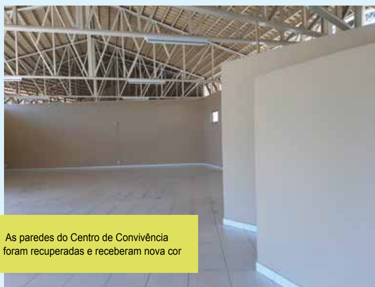
As paredes do Centro de Convivência foram recuperadas e receberam nova cor