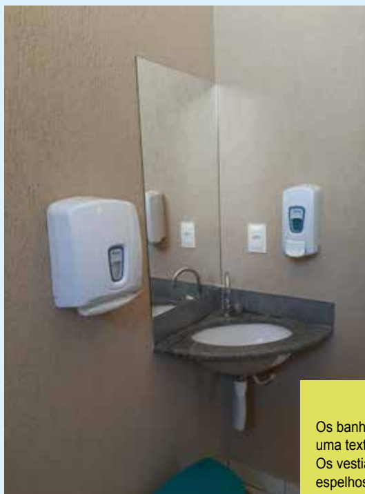
Os banheiros receberam uma textura e nova pintura. Os vestiários ganharam espelhos que vão dar mais conforto aos usuários.