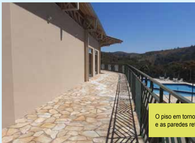
O piso em torno da área de convivência foi todo lavado e as paredes reformadas, ganhando nova pintura