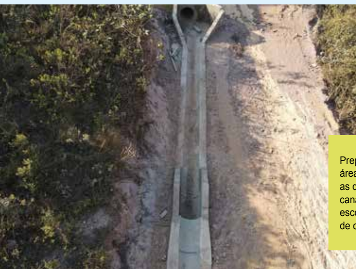
Preparação do leito na área de servidão entre as quadras 16 e 17 e canaletas prontas para o escoamento das águas de chuva sem erosões

Desta forma, a Associação cumpre sua função de cuidar das áreas que apresentavam problemas e que, durante o período das chuvas, poderiam trazer uma série de transtornos para os moradores do Residencial.